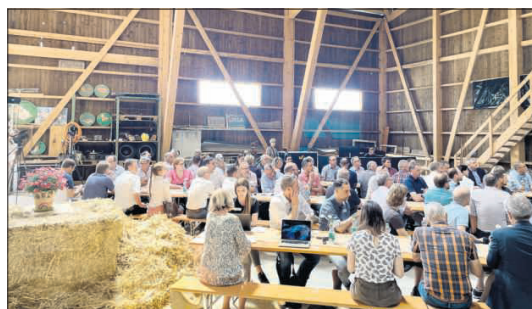
Die Auftaktveranstaltung findet auf dem Hof Krieshütten oberhalb von Luthern statt.

Die 22 Gemeinden aus der Region Luzern West gründeten im vergangenen Oktober eine einfache Gesellschaft und machten sich damit auf den Weg zu einer eigenen, unabhängigen Lösung des Internetproblems. Aus dem EA-Gebiet mit