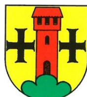
Escholzmatt - Marbach